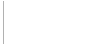
czytelny podpis reprezentanta